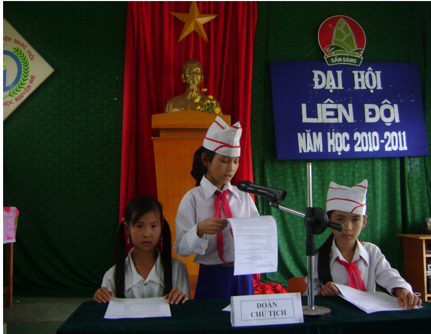
Đoàn Chủ tịch thông qua dự thảo phương hướng nhiệm vụ