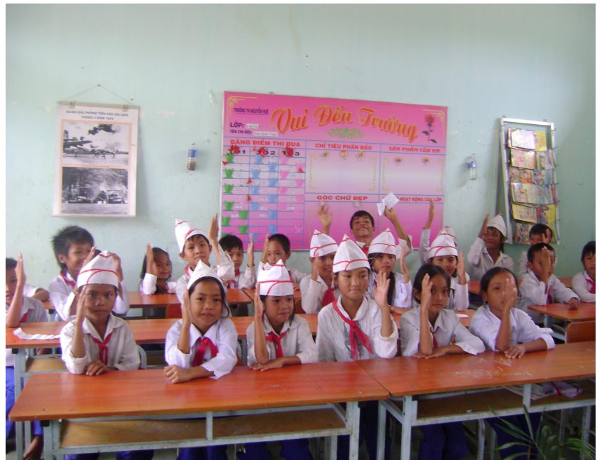
Đội viên thống nhất dự thảo phương hướng đã đề ra

Chú ý nêu những tấm gương tốt, điển hình trong các hoạt động, chỉ ra những việc cần phải nhân rộng, học tập và phát huy.