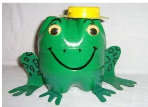
(Ảnh 33: Chiếc hộp ngộ nghĩnh)