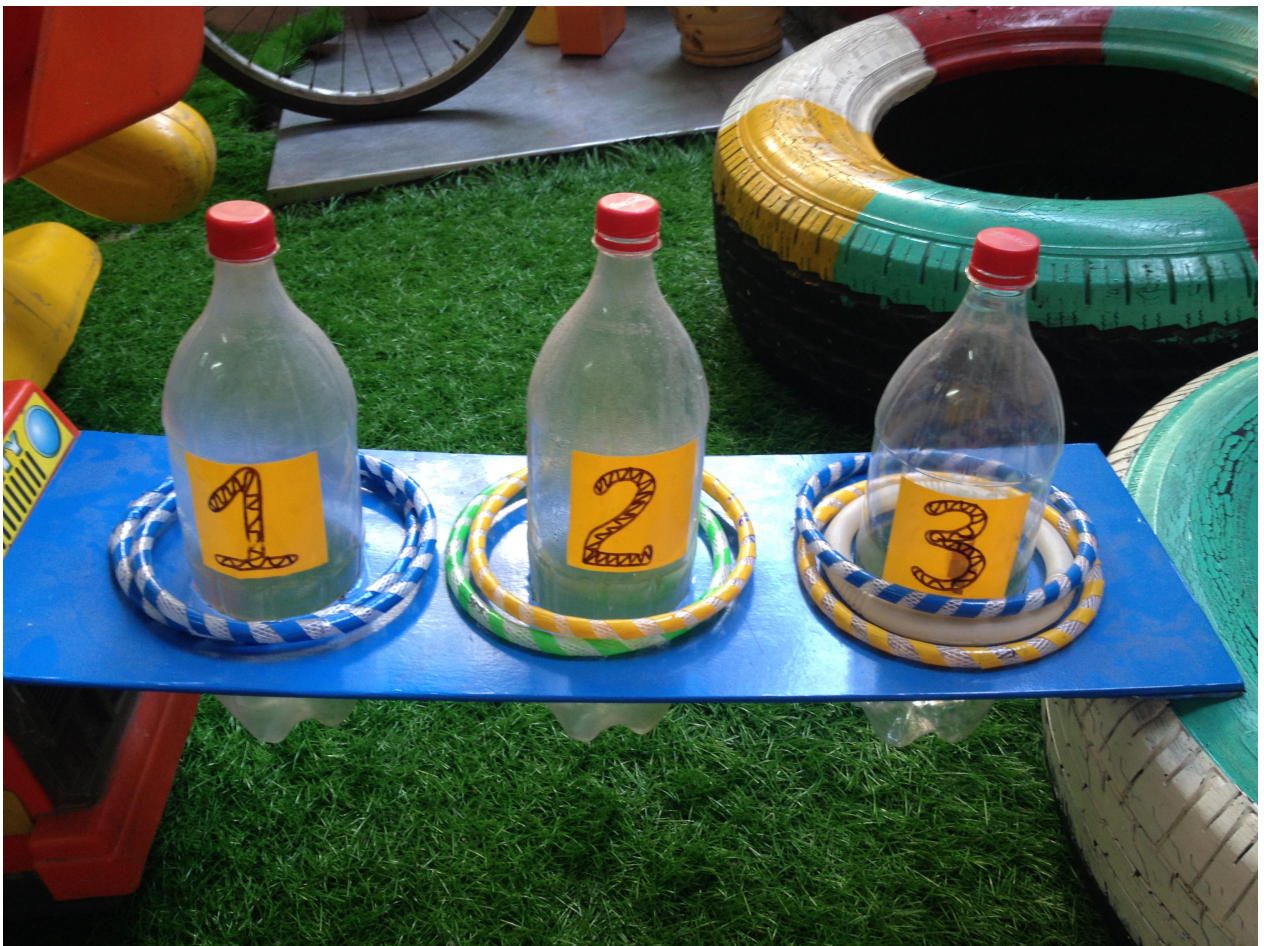
(Ảnh 14: Trò chơi ném vòng)

Cách sử dụng: Khi tổ chức trò chơi, cô cho trẻ lần lượt đứng ở vạch ném vòng sao cho trúng vào 1 trong 3 chai nước. Ném trúng vào 1 trong 3 chai nước là chiến thắng. (Ảnh 15)