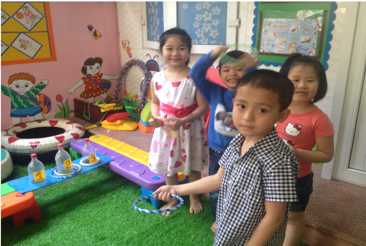
(Ảnh 15: Trẻ chơi trò chơi ném vòng vào chai)

Trẻ có thể sử dụng trong những hoạt động: Hoạt động học, hoạt động góc