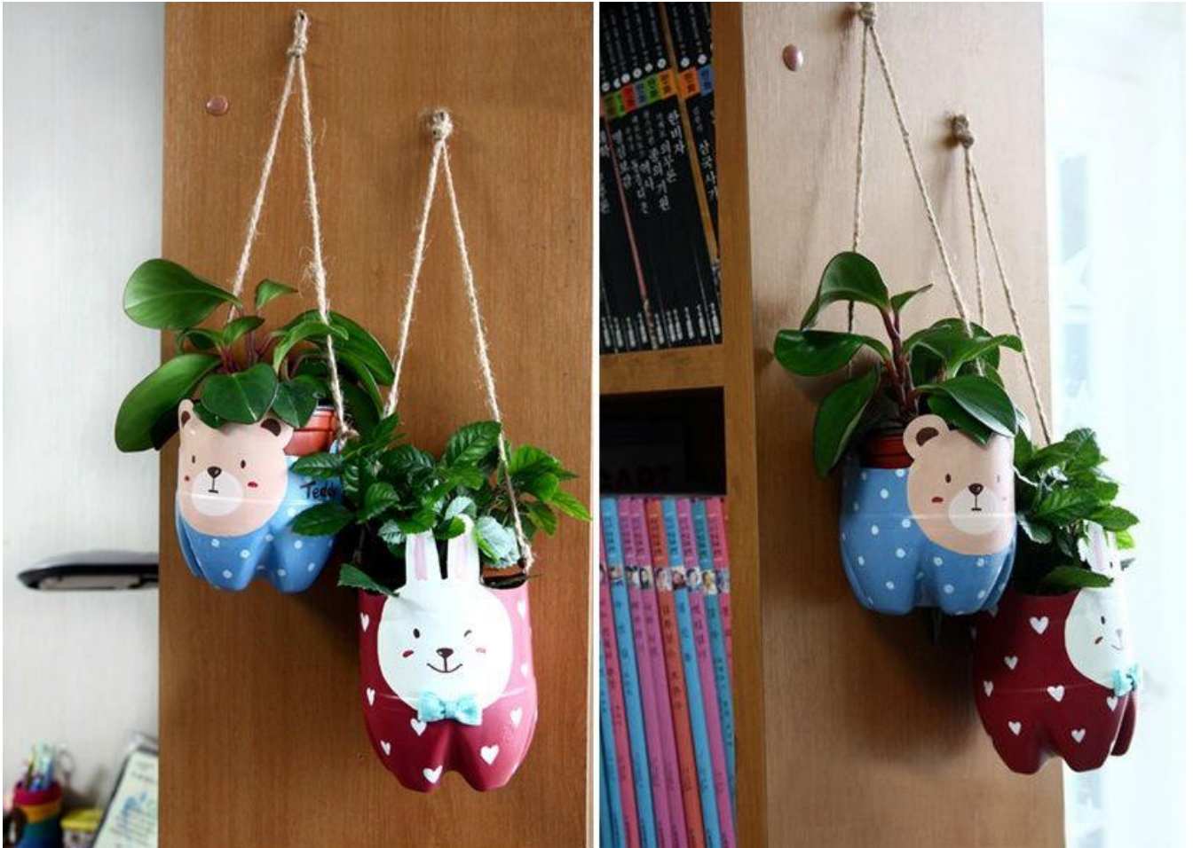
(Ảnh 31: Chậu cây đáng yêu)

Hàng ngày trẻ sẽ tự mình đi tưới và chăm sóc những chậu cây nhỏ xinh đó, trẻ rất hứng thú và yêu lao động hơn, còn bản thân tôi thì không cần phải bỏ tiền để mua những chậu cây có sẵn, kết quả thu được lại rất cao.