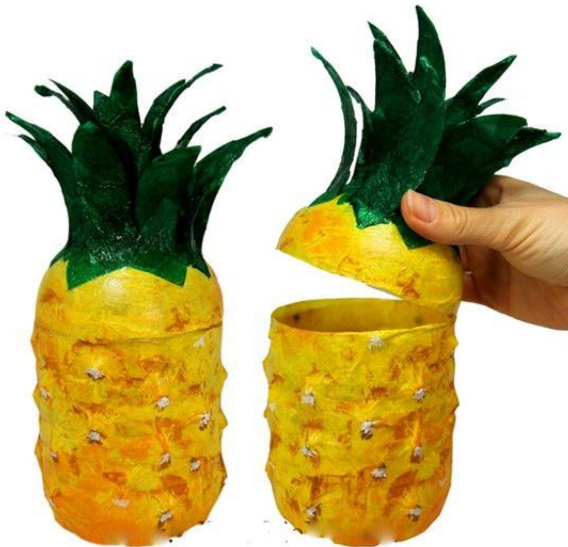
(Ảnh 34: Quả dưa kỳ lạ)

- Dùng 1 chiếc chai nhựa cùng 1 chút màu nước nên những quả dưa xinh xắn mà lại chứa đựng rất nhiều bí mật bên trong (Ảnh 34)