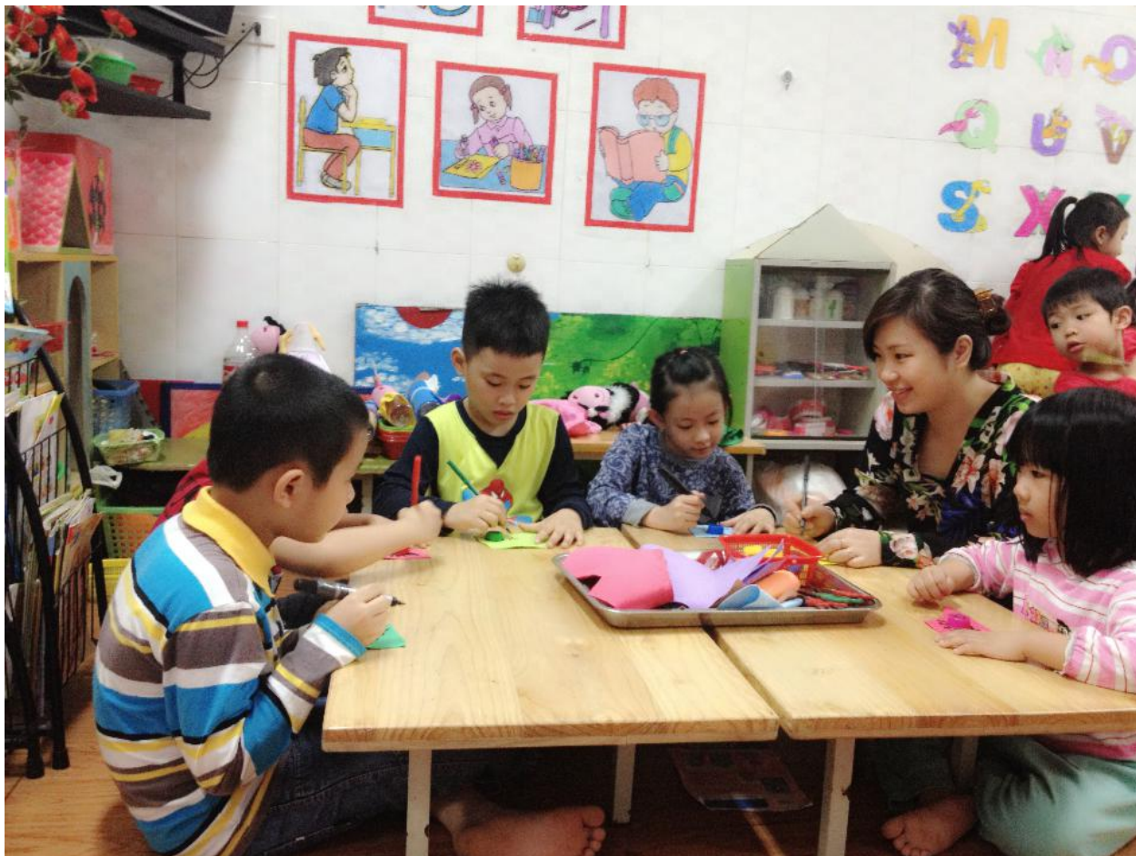
(Ảnh 8: Cô cùng trẻ đang làm các con vật từ nắp chai)

Cách làm con rùa: Cô dùng nắp chai làm thân con rùa, áp nắp chai vào xốp màu để vẽ thân, đầu và chân của con rùa. Cắt rời phần xốp màu vừa vẽ và dán vào nắp chai. Vẽ thêm mắt, vây và trang trí cho đẹp là hoàn thành. ( Ảnh 8)