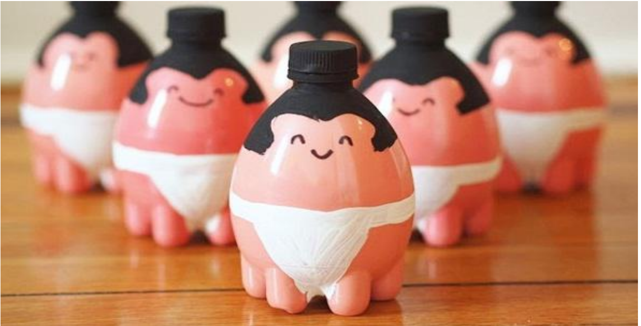
( Ảnh 1: Những lực sĩ sumo dễ thương được làm từ chai nhựa)

Cách làm lực sĩ sumo nhật bản: Cô sưu tầm các chai nhựa nhỏ xinh không quá to sau đó cô dùng màu nước sơn màu cho các chai nhựa. Cuối cùng cô dùng bút dạ viền lại hình cho nhân vật, vẽ mắt, mũi, mồm... ( Ảnh 1)