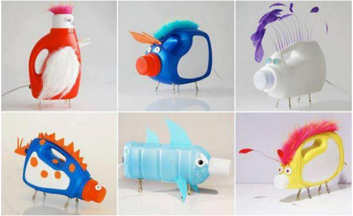
(Ảnh 12: Những con vật làm từ vỏ chai)