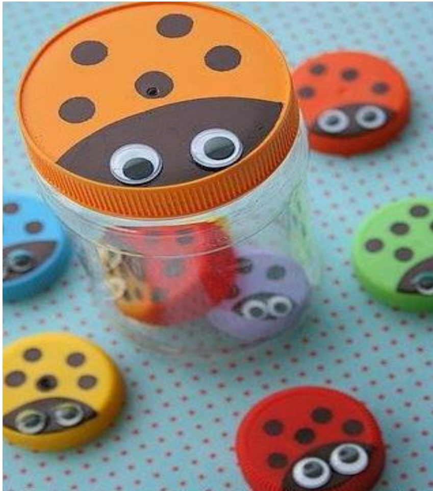
(Ảnh 36: Hộp đựng đồ đáng yêu)

- Dùng làm hộp đựng đồ đáng yêu. (Ảnh 36)