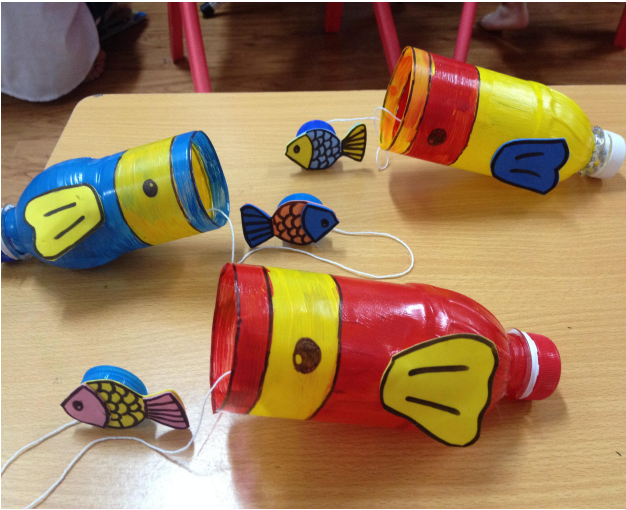
(Ảnh 23: Trò chơi cá lớn nuốt cá bé)