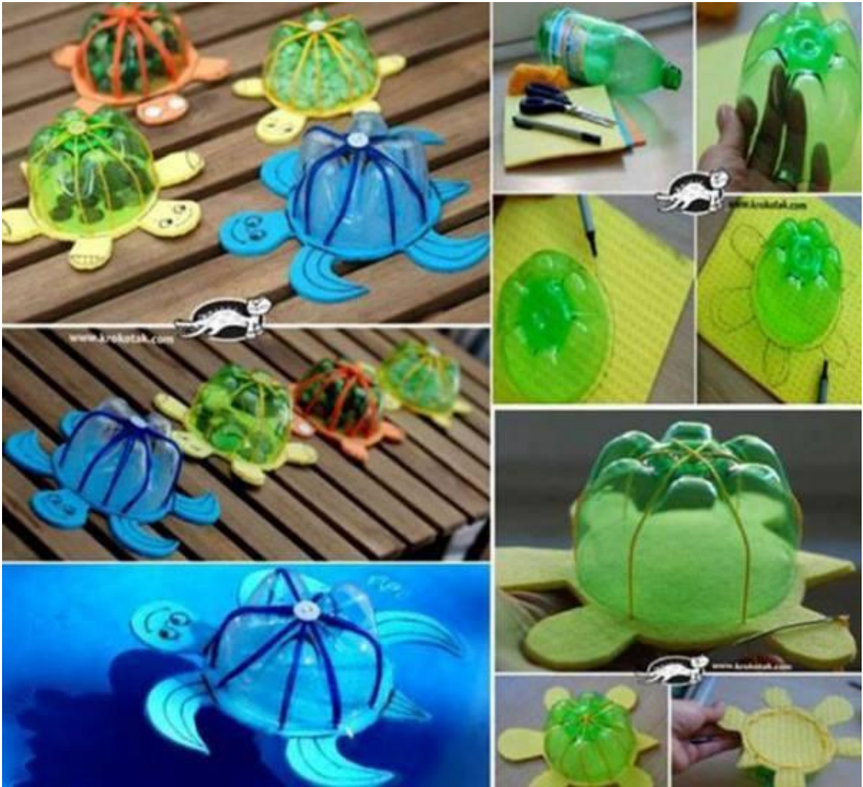
( Ảnh 2: Chú rùa xinh xắn, đáng yêu)

Cách làm những con rùa xinh xắn, đáng yêu: Dùng chai nhựa to làm vật mẫu của cô và có thể kết hợp với trẻ làm những con rùa nhỏ bằng nắp chai để vừa với tầm tay trẻ. Cắt 6cm phần đáy chai nhựa để làm mai của con rùa, áp phần đáy chi vào xốp màu để vẽ thân, đầu và chân của con rùa. Cắt rời phần xốp màu vừa vẽ và dán vào phần chai nhựa đã cắt. Vẽ thêm mắt và trang trí cho đẹp là hoàn thành. ( Ảnh 2)