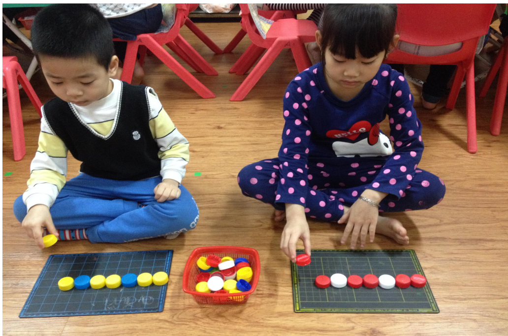
( Ảnh 5: Trẻ đang đếm, sắp xếp theo quy tắc 2-1)

Trẻ dùng nắp chai sắp xếp theo quy tắc, phân biệt màu sắc...(Ảnh 5)