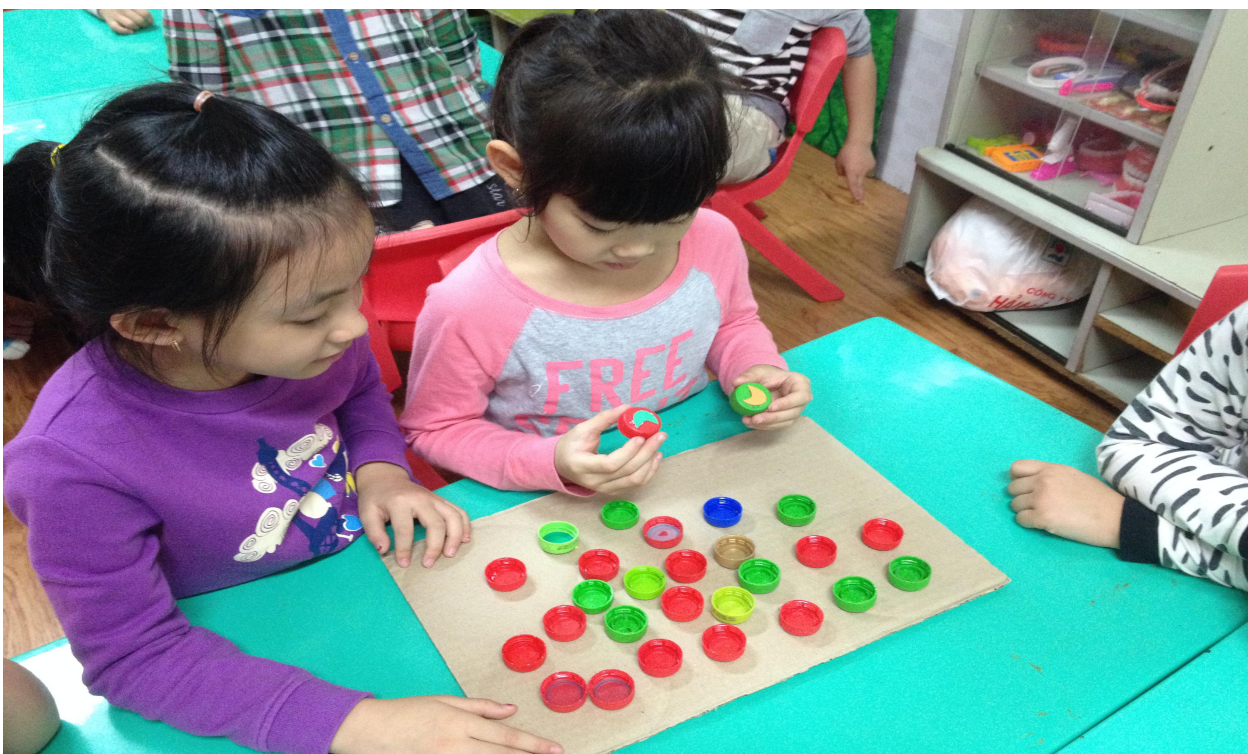
(Ảnh 16: Hai bạn đang cùng nhau chơi trò chơi những nắp chai thần kỳ)