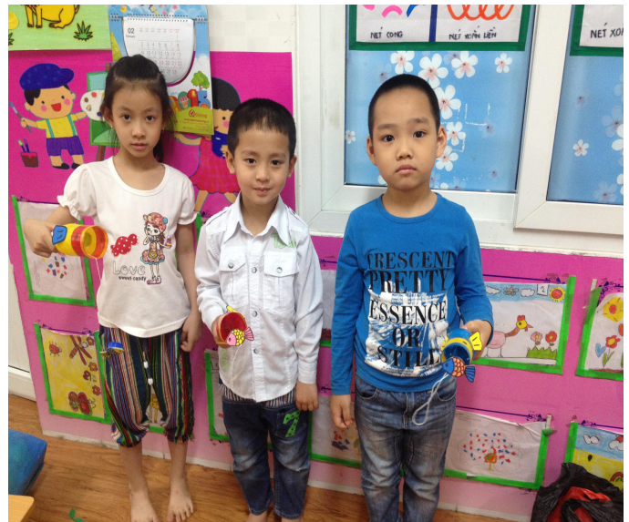
(Ảnh 24: Trẻ đang chơi trò chơi)