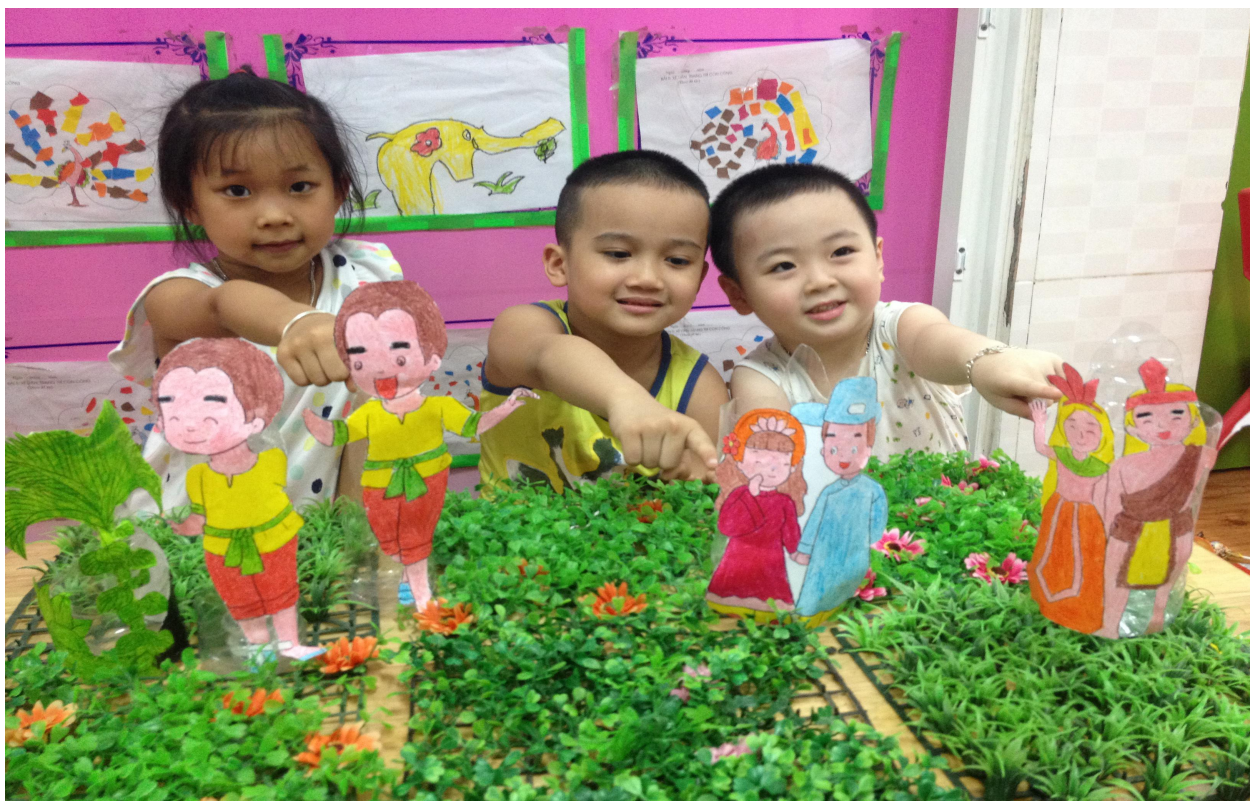
(Ảnh 9: Trẻ đang sử dụng rối vỏ chai)

Cách làm rối vỏ chai 1: Cô vẽ hình nhân vật ra giấy sau đó cho trẻ tô màu thật đẹp mắt. Cô dùng bút dạ vẽ lại viền cho các nhân vật cho thêm phần sinh động. Cô dán nhân vật vừa làm vào chai nhựa nhưng cuộn nhân vật để vào bên trong chai nhựa, cô dán sao để cho phần chân nhân vật chạm vào đáy chai để khi kể chuyện nhìn như nhân vật đang đứng. Từ đáy chai, cô đo lên 5-7cm cắt bỏ phần chai thừa từ đó, cắt khéo léo để không cắt vào nhân vật. (Ảnh 9)