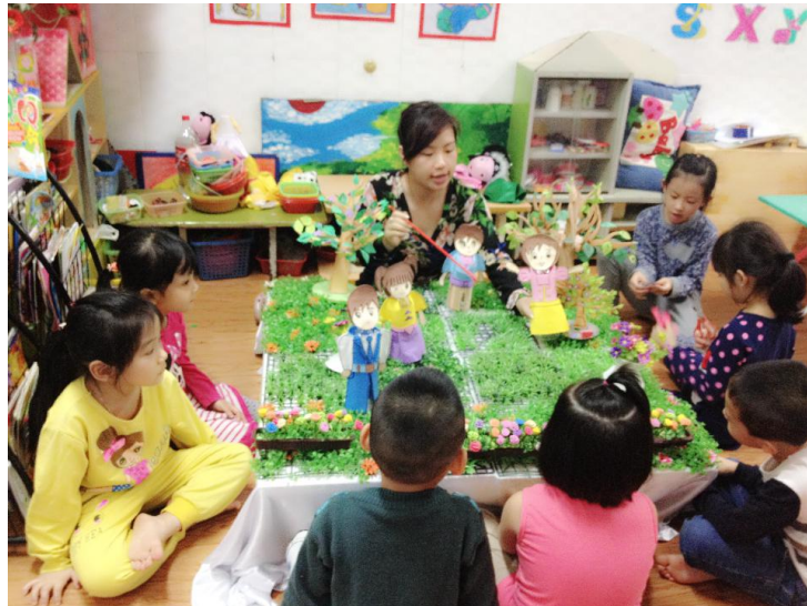
(Ảnh 11: Cô đang kể chuyện bằng rối vô chai)