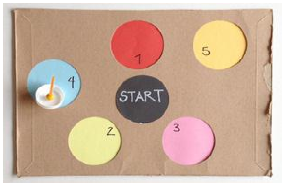
(Ảnh 27: Đồ chơi con quay đặc biệt chơi theo cách 2)

* Cách 3: Dùng miếng bìa 2 để chơi, trẻ bắt đầu quay con quay từ hình tròn đen có chữ Start. Khi con quay đang quay trẻ dùng miệng thổi sao cho con quay đi thẳng tới vòng