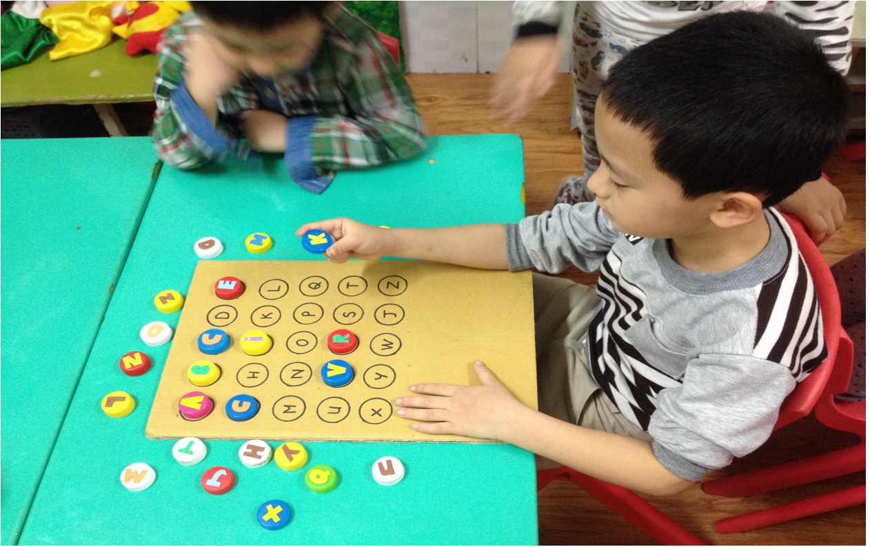
(Ảnh 17: Trẻ đang chơi trò chơi thử tài nhanh trí)