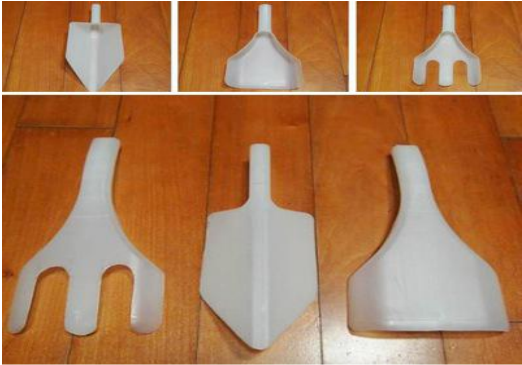
(Ảnh 29: Đồ chơi người làm vườn thông thái)