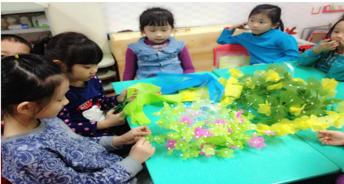
(Ảnh 32: Trẻ đang làm lẵng hoa)

- Ngoài ra tôi cùng với trẻ dùng vỏ chai coca tạo thành những lẵng hoa trang trí lớp. Dùng vỏ chai cắt đoạn đầu ra sau đó cắt nhỏ tạo thành cành hoa, lấy giấy màu cắt hoa và cô với trẻ sẽ khâu những bông hoa kết hợp những hạt xốp để tạo thành lẵng hoa nhiều màu sắc treo tại lớp (Ảnh 32)