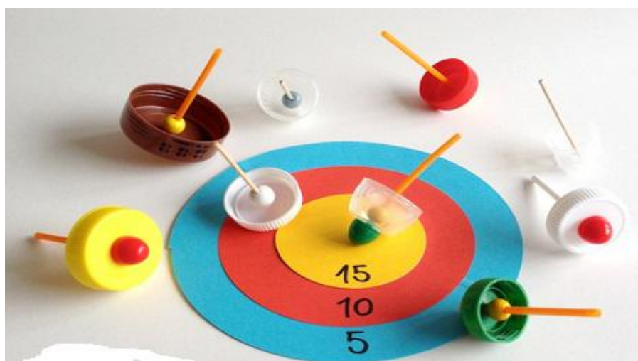
(Ảnh 26: Đồ chơi con quay đặc biệt chơi theo cách 1)

* Cách 2: Dùng miếng bìa 1 để chơi, trẻ bắt đầu quay con quay từ hình tròn đen có chữ Start. Mỗi bạn có 2 con quay và trò chơi này có 2 bạn chơi với nhau. Khi con quay đang quay trẻ dùng miệng thổi sao cho con quay dừng lại ở vòng tròn có số điểm lớn nhất. Bạn sau chơi không được để quay dừng lại cùng vòng tròn của bạn trước. Sau 4 lượt đi của 2 bạn, bạn nào được nhiều điểm hơn là chiến thắng.