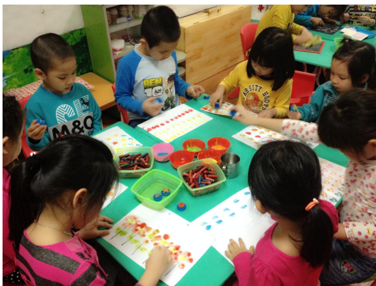
(Ảnh 22: Trẻ đang dùng con dấu để tạo hình bức tranh.)