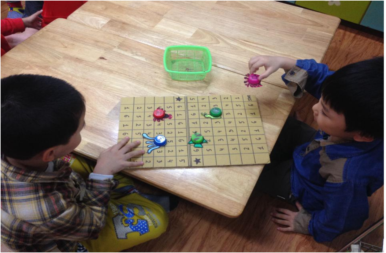
(Ảnh 25: Trẻ đang chơi trò chơi AI MAY MẮN HƠN. )