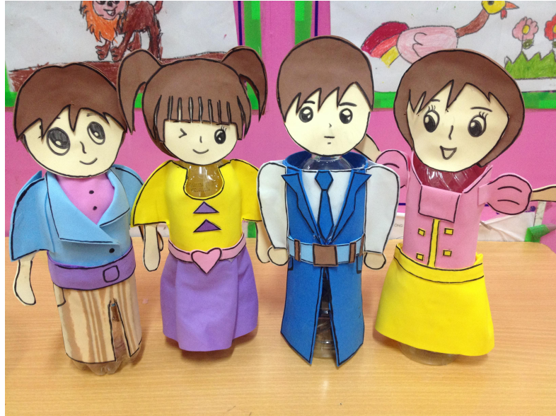
(Ảnh 10: Các con rối vô chai chủ đề gia đình)

Cách làm rối vô chai 2: Cô dùng vỏ chai để làm thân các con rối, dùng vải dạ-xốp màu,giấy màu làm quần áo mặc cho vỏ chai. , cô vẽ nhân vật ra giấy bìa sau đó tô màu thật đẹp. Tùy vào nội dung từng câu chuyện, cô thay mặt các nhân vật vào vỏ chai đã được mặc quần áo. (Ảnh 10)